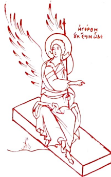
Ἄγγελος ἐκ τῆς οὐράς

Ϟ ἦλθες ψηλὰ ἀπὸ τοὺς Οὐρανοὺς καὶ κατέβηκες στὴ γῆ, Χριστέ καὶ Θεέ μας, γεμάτος ἀπὸ εὐσπλαγχνία καὶ ἀγάπη γιὰ μᾶς· καταδέχτηκες, μετὰ τὸ μαρτυρικό θάνατό σου, νὰ ὑποστῆς τὸν ἐνταφιασμό γιὰ τρεῖς ἡμέρες, μὲ μοναδικὸ σκοπὸ νὰ μᾶς ἀπελευθερώσῃς καὶ νὰ μᾶς ἀπαλλάξῃς ἀπὸ τὰ δεινὰ τῆς ἁμαρτίας. Σὺ, λοιπόν, Κύριε, ποὺ μ' αὐτὸ τὸ μεγάλο θαῦμα τῆς ἀγάπης σου καὶ τῆς θυσίας σου ἔγινες γιὰ μᾶς ἡ πραγματικὴ ζωὴ καὶ ἡ ἀληθινὴ ἀνάστασις, ἃς εἶσαι δοξα- σμένος.