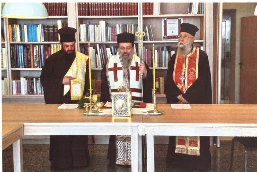
Ἐναρξις «ΘΕΟΛΟΓΙΚΟΥ ΑΝΑΛΟΓΙΟΥ» εἰς Βιβλιοθήκην ΛΓ. ΑΓΑΠΗΤΟΣ (22 Ἀπριλίου 2026)