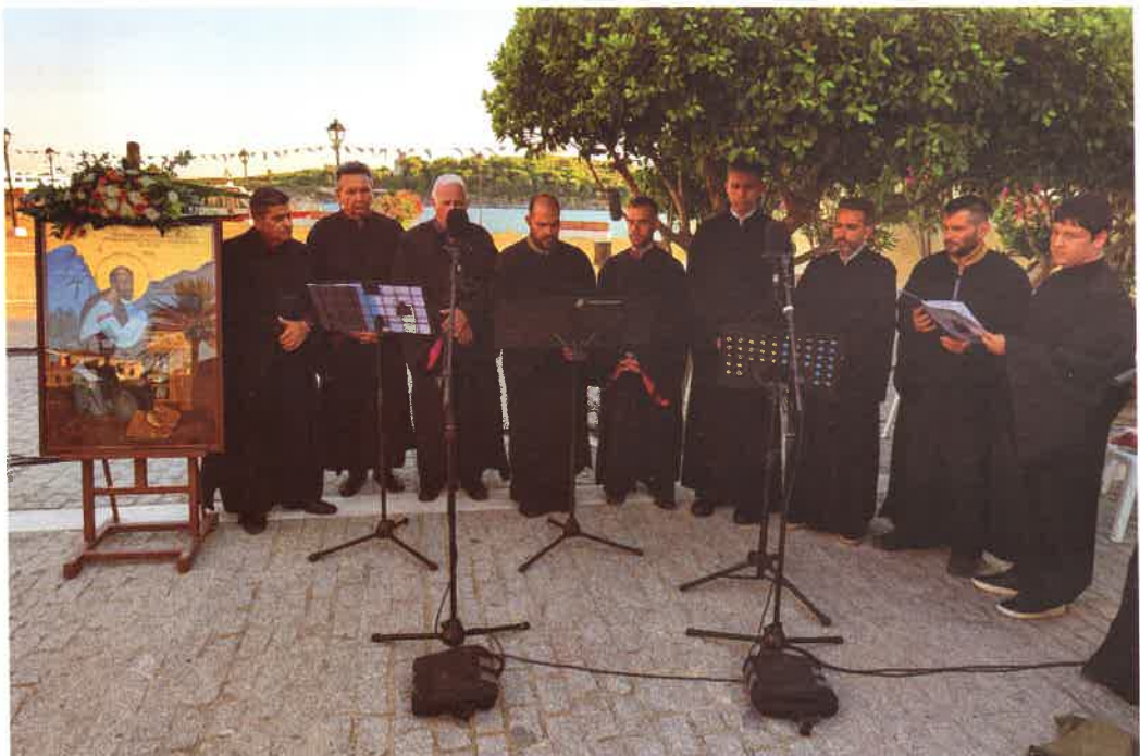
Ἀπό τόν ἑορτασμόν τοῦ Ἀπ. Παύλου εἰς Οἰνούσσας (29 Ἰουνίου 2026)