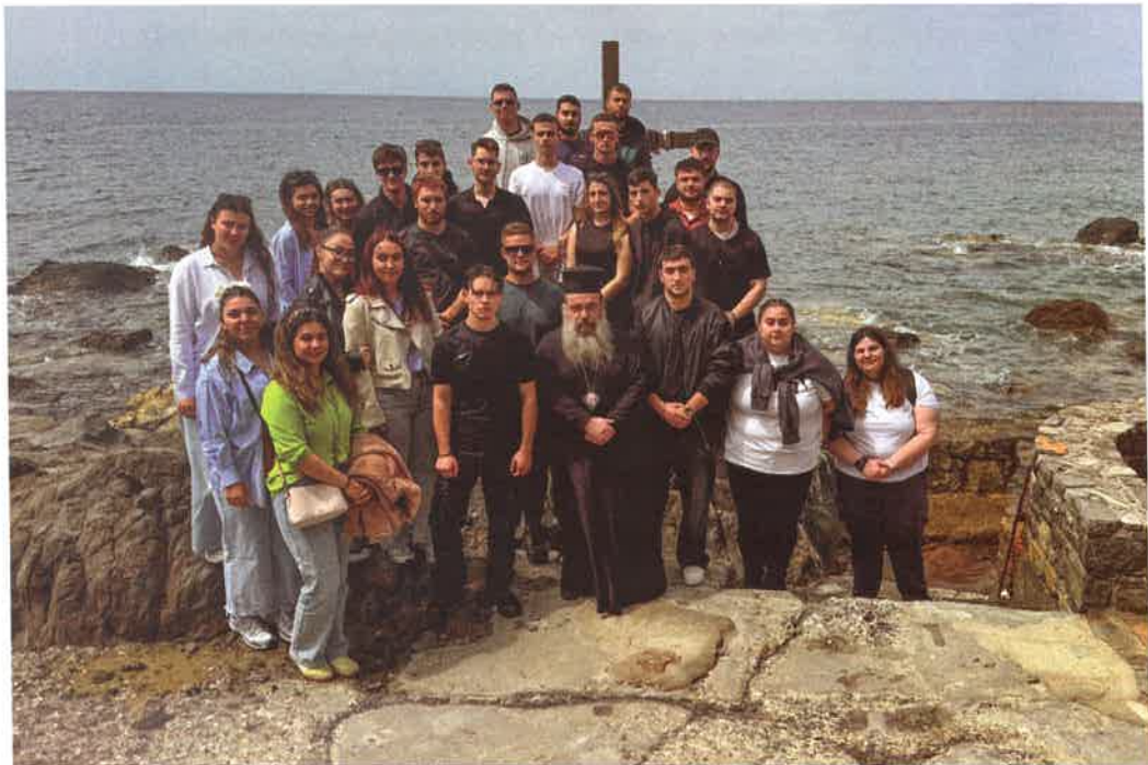
Ὁ Ἐπίσκοπος μετὰ φοιτητῶν εἰς τὸ Ἅγιασμα (τόπον μαρτυρίου) Ἁγίας Μαρκέλλης (9 Μαΐου 2026)