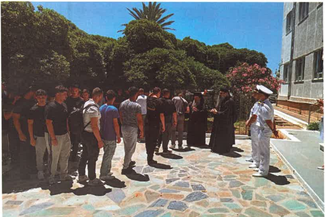
Εὐλογία πρὸς Σπουδαστὰς ΑΕΝ Πλοιάρχων Οἰνουσσῶν (11 Ἰουνίου 2026)