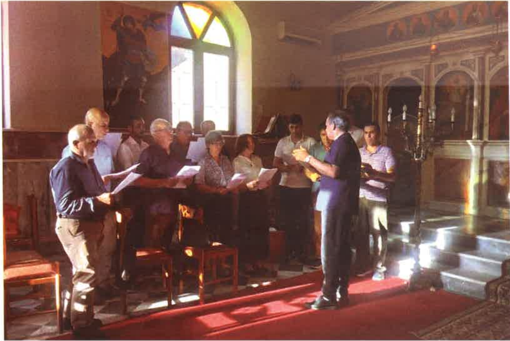
«Ἄδοντες καί ψάλλοντες» Λήξις Σχολῆς Βυζαντινῆς Μουσικῆς (12 Ἰουνίου 2026)