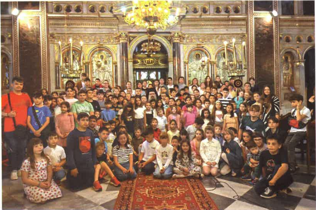
«Λεφετε τὰ παδία ἔλθειν πρὸς με» Λῆξι Κατηχητικῶν Σχολείων (17 Μαΐου 2026)