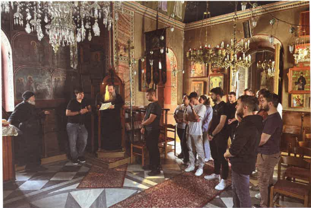
Ὁ Ἐπίσκοπος μετὰ φοιτητῶν εἰς Ἱ. Μονήν Μυρσινιδίου (9 Μαΐου 2026)