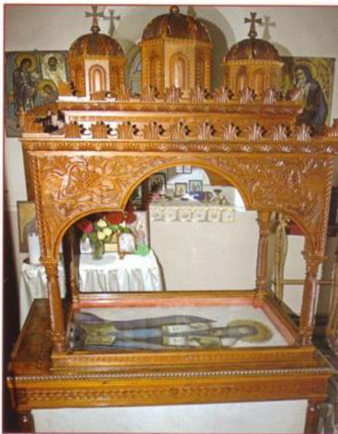
Ὁ τάφος τοῦ ἐν Ἁγίοις Πατρὸς ἡμῶν Μακαρίου, Ἀρχιεπισκόπου Κορίνθου τοῦ Νοταρᾶ, εἰς Βροντάδον.