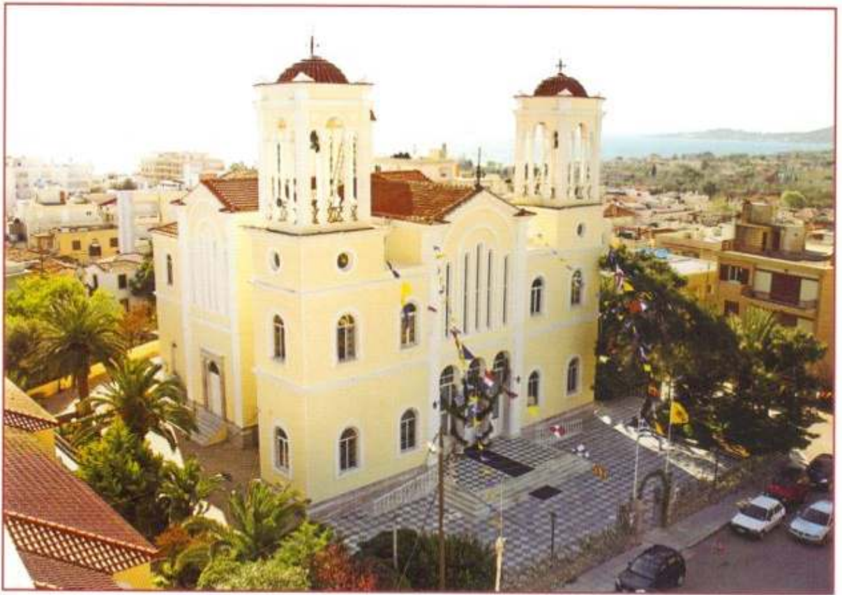
Ὁ Ἱερός Ναός Εὐαγγελιστρίας, πόλεως Χίου.