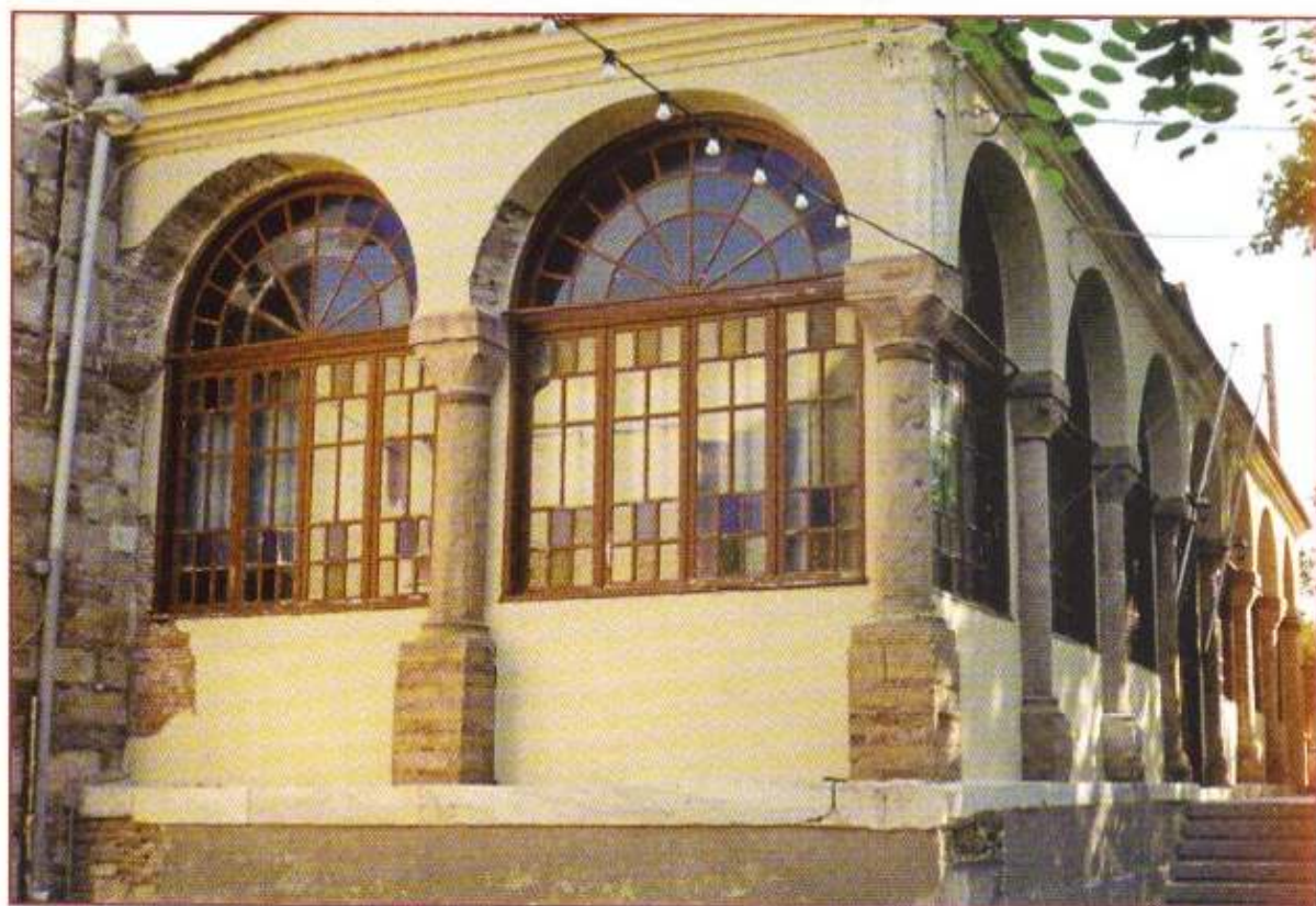
Ό Τερός Ναός Αγίου Γεωργίου Φρουρίου, πόλεως Χίου.