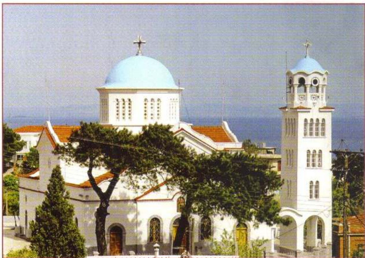
Ὁ Ἱερός Ναός Ἁγίου Μάρκου, εἰς Βροντάδον Χίου.

ΠΛΗΡΩΜΕΝΟ ΤΕΛΟΣ PORT PAYÉ Τακ. Τροφεῖο ΧΙΟΥ Αρ. Α6 ΕΛΛΑΣ - HELAS