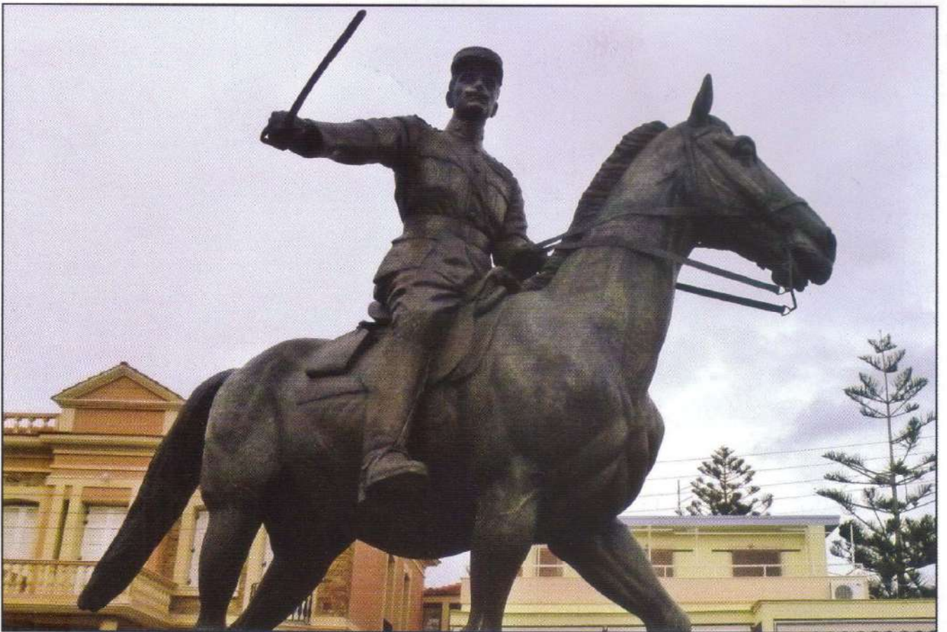
Ὁ Στρατηγὸς Νικόλαος Πλαστήρας. Ἀπὸ τὴν τελετὴν τῶν ἀποκαλυπτηρίων τοῦ ἀνδριάντος τὴν 10ῃν Φεβρουαρίου 2013

ΠΑΡΟΜΕΝΟ ΤΕΛΟΣ PORT PAYE Τὸν ἔσοδος 9001 Αρ. 45 ΕΛΛΑΣ - HELAS