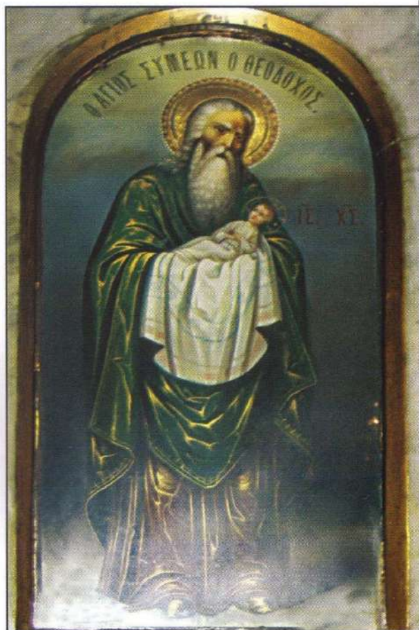
Ὁ Ἅγιος Συμεὼν ὁ Θεοδόχος. (Ἱερὰ εἰκὼν Τέμπλου Ἱερᾶς Μονῆς Μυρσινιδίου)