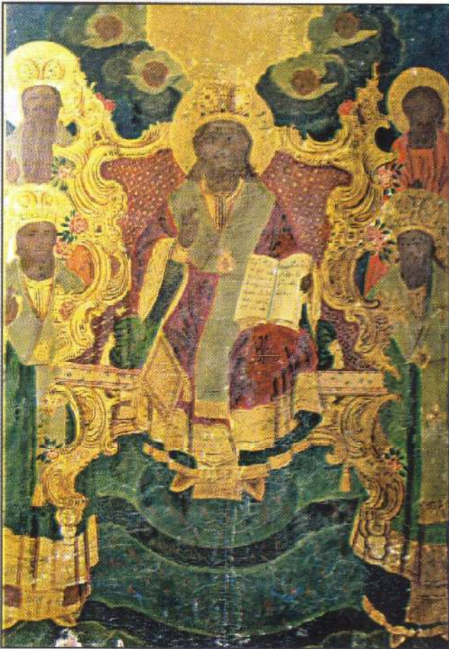
Ὁ Κύριος πλαισιούμενος ἀπὸ τὸν Ἀπόστολον καὶ Εὐαγγελιστὴν Μάρκον καὶ τοὺς Τρεῖς Ἱεράρχες. (Εἰκὼν εὕρισκομένη εἰς τὸ Γ' Δημοτικὸν Σχολεῖον Ἁγίου Μάρκου Βροντάδου)