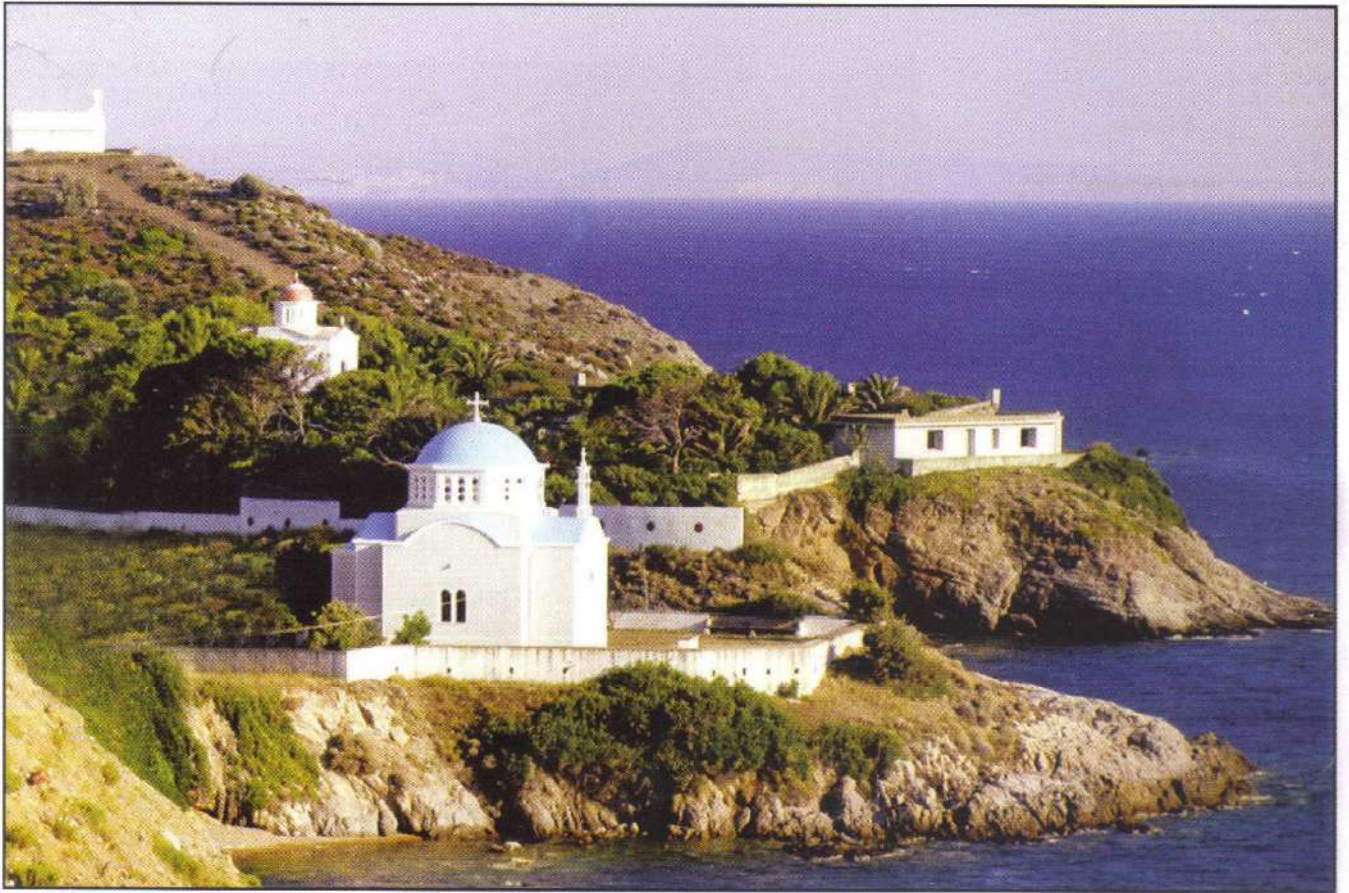
Ὁ Ἱερός Ναός τῶν Τριῶν Ἱεραρχῶν εἰς τὰ Ἐκπαιδευτήρια τῆς Νήσου Οἰνουσσῶν