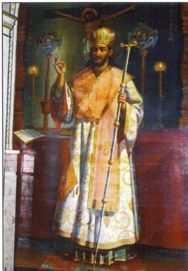
Ὁ Ἅγιος Ἰωάννης ὁ Χρυσόστομος. (Ὡραία Πύλη Ἱεροῦ Μητροπολιτικοῦ Ναοῦ Χίου)