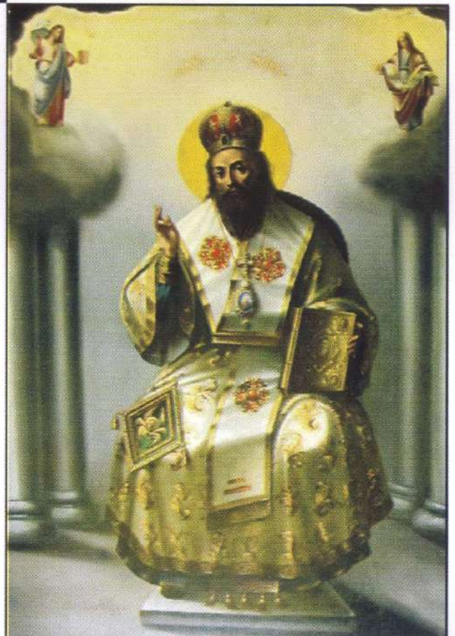
Ὁ Μέγας Βασίλειος. (Ἱερὰ εἰκὼν Τέμπλου Ἱεροῦ Ναοῦ Ἁγίου Ἰακώβου, πόλεως Χίου)