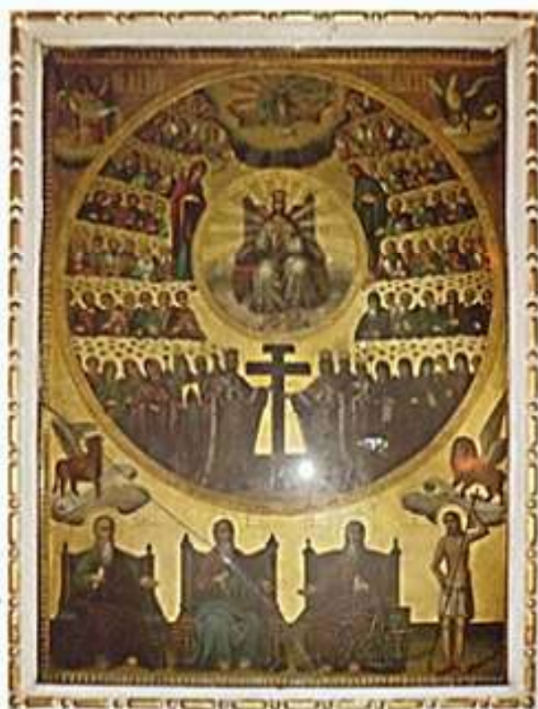
Ἱερὰ Εἰκὼν τῶν Ἁγίων Πάντων εἰς τὸν Ἱ. Ναὸν Ἁγ. Γεωργίου «Σταφυλᾶ» Κάμπου, ἔνθα ἐορτάζεται πανηγυρικῶς ἡ μνήμη των. (Ἐπιλοτεχνήθη εἰς τὴν Ἱ. Σκήτην Ἁγ. Πατέρων Χίου τὴν 26-3-1914 δαπάναις τῶν Καμπουσίων Ἀμερικῆς).