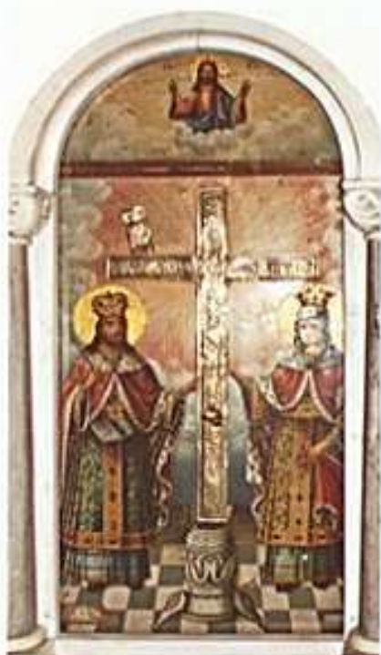
Ἱερὰ Εἰκὼν Ἁγίων Κωνσταντίνου καὶ Ἑλένης εἰς τὸ τέμπλον τοῦ ὁμωνύμου Ἱεροῦ Ναοῦ Πισπιλούντας Χίου.