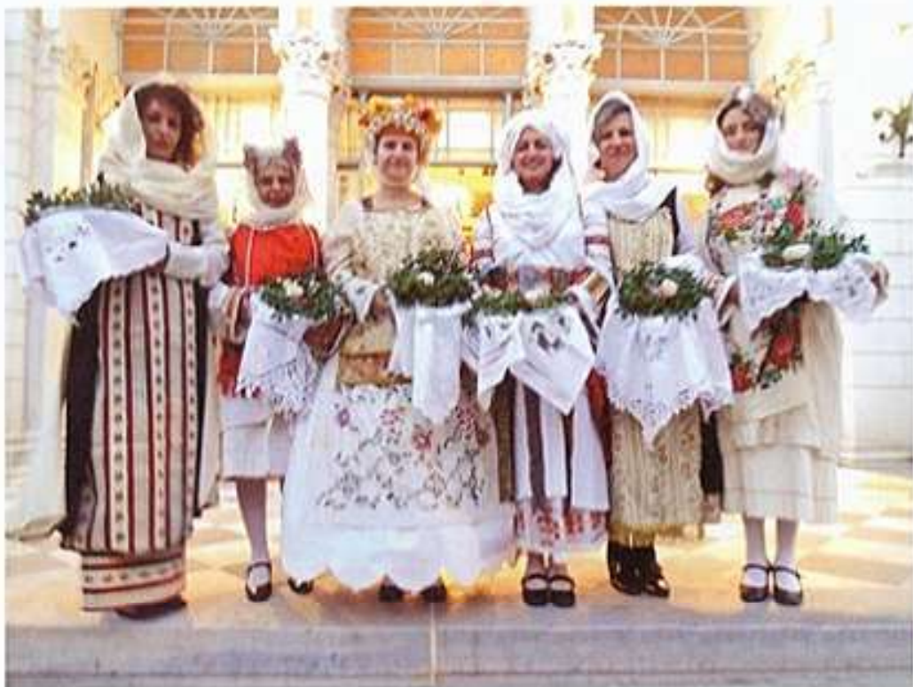
Χιώτισσες με παραδοσιακές ένδυμασίες Μαστιχοχωρίων φέρουναι σχίνον και μαστίχαν κατά την Έορτήν του Άγιου Ίσιδώρου του έν Χίω.