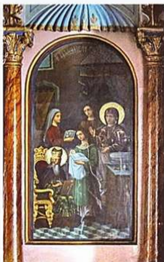
Ἱερά Εἰκὼν τοῦ Γενεσίου τοῦ Ἁγίου Ἰωάννου τοῦ Προδρόμου εἰς τὸ τέμπλον τοῦ ὁμωνύμου Ἱ. Ναοῦ Καταρράκτου Χίου.