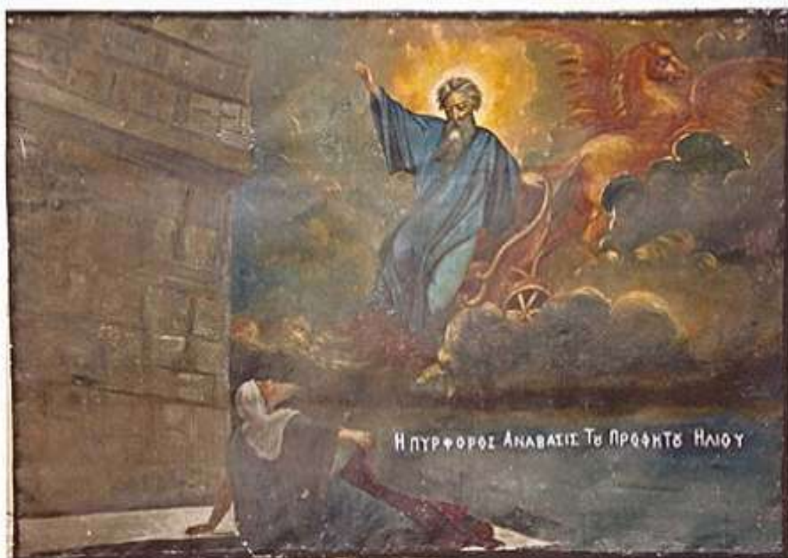
Ἱερά Εἰκὼν τῶν Προφητῶν Ἡλιοῦ καὶ Ἐλισσαίου εἰς τὸν Ἱ. Ναὸν Προφήτου Ἡλιοῦ Βροντάδου.