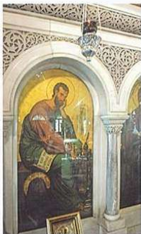
Κανθῆλιον δωρηθὲν ὑπὸ τοῦ Οἰκουμενικοῦ Πατριάρχου κ. ΒΑΡΘΟΛΟΜΑΙΟΥ κατὰ τὴν ἐπίσκεψίν Του εἰς τὸν Ἱερὸν Ναὸν Ἁγίου Μάρκου Βροντάδου τὴν 13ην Σεπτεμβρίου 2015.