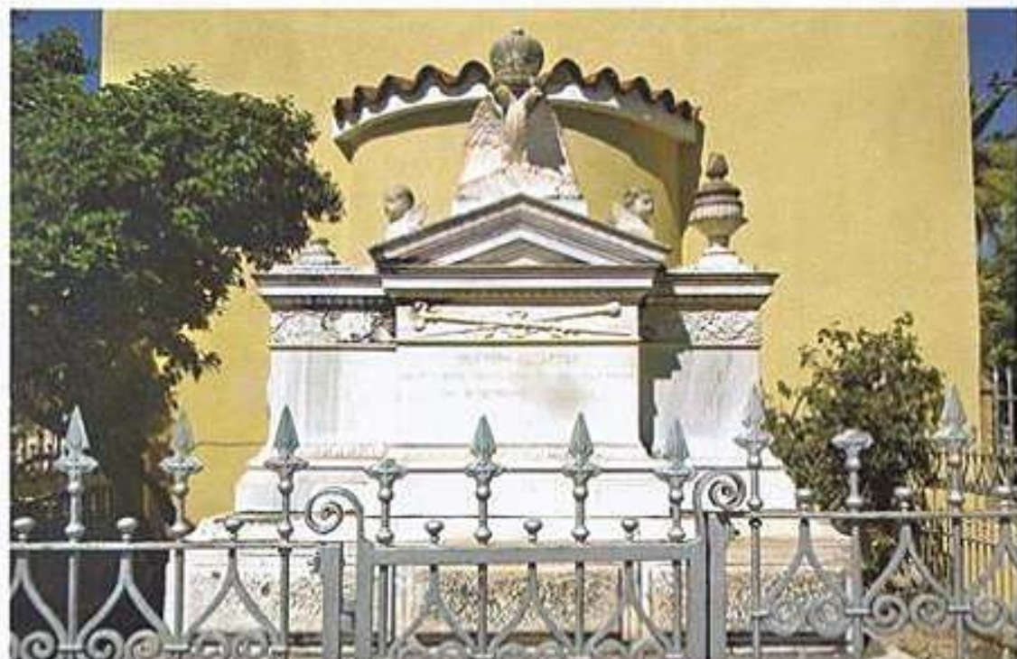
Μνημείον καί Τάφος Οικουμενικοῦ Πατριάρχου Ἰωακείμ τοῦ Δ' εἰς Καλλιμασιάν Χίου.