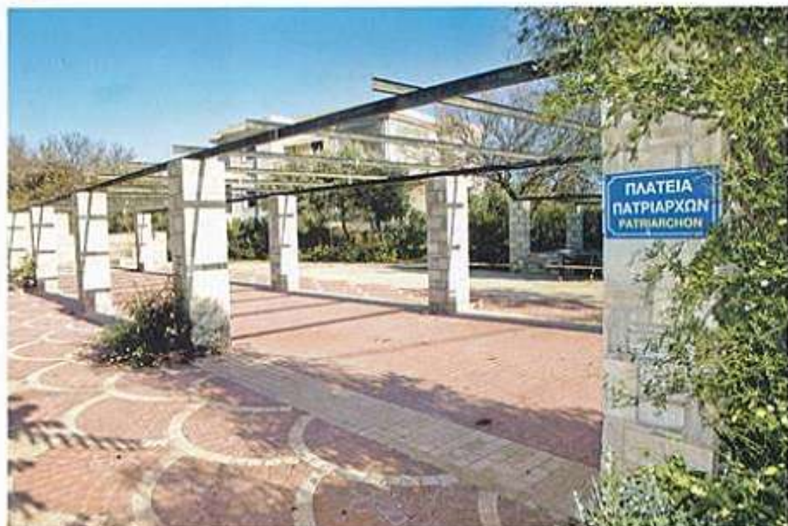
Ἡ Πλατεία Πατριάρχων εἰς Καλλιμασίαν ὀνομασθεῖσα εἰς τιμὴν τῶν ἐκ Καλλιμασίας Οἰκουμενικῶν Πατριάρχων Ἰωακείμ Β' καὶ Ἰωακείμ Δ'.