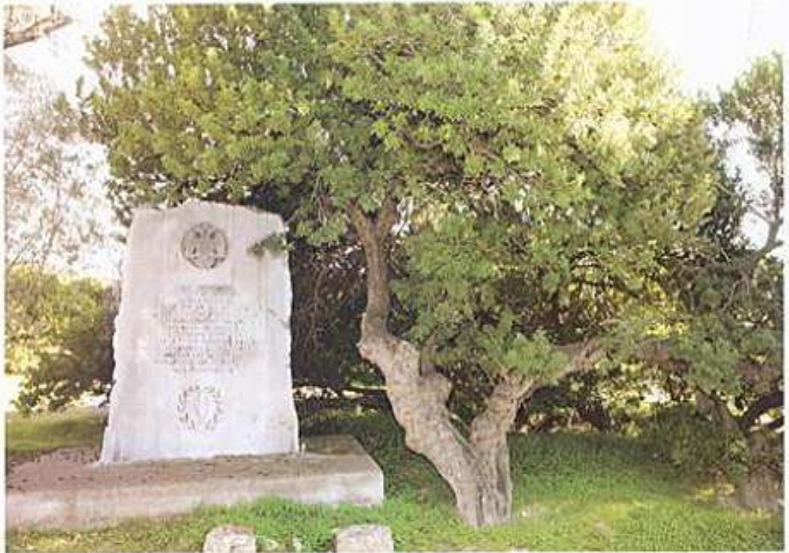
Αναθηματική στήλη περί του γεντήματος μαστιχοφόρου σχίνου εις Καλλιμασιάν κατά την επίσκεψιν τοῦ Οἰκουμενικοῦ Πατριάρχου κ. ΒΑΡΘΟΛΟΜΑΙΟΥ τὴν 18ην Αὐγούστου 1997.