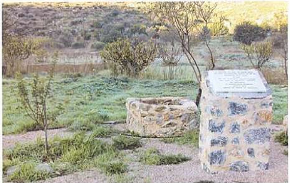
Ὁ μαστιχοφόρος σχίνος τὸν ὁποῖον ἐφύτευσεν εἰς τὴν πυρόπληκτον Βέσσαν ὁ Οἰκουμενικός Πατριάρχης κ. ΒΑΡΘΟΛΟΜΑΙΟΣ κατά τὴν ἐπίσκεψίν Του τὴν 12ην Σεπτεμβρίου 2015.