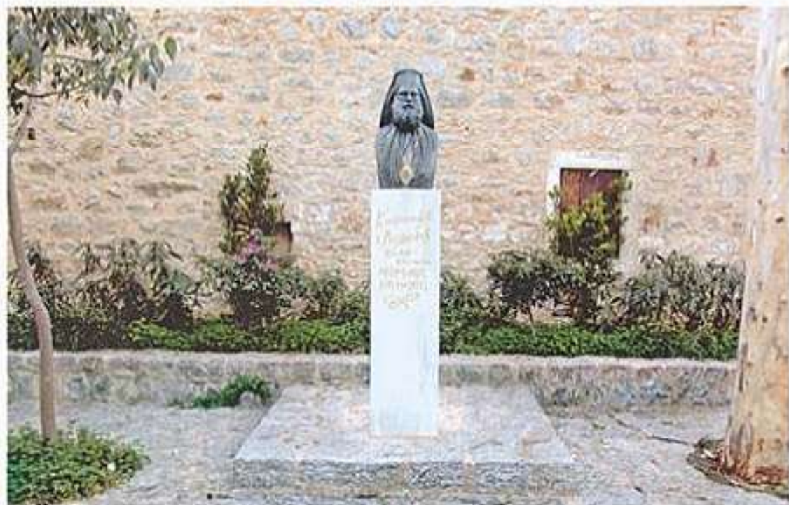
Προτομή τοῦ ἐκ Βέσσης Οἰκουμενικοῦ Πατριάρχου Κωνσταντίνου τοῦ Ε' (Βαλλιάνου) εἰς Βέσσαν Χίου.