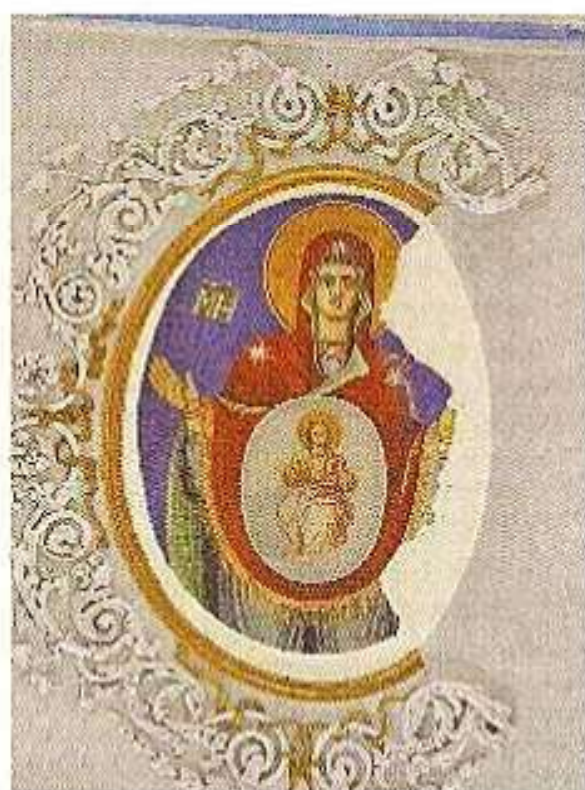
Τοιχογραφία Ἱεροῦ Ναοῦ Ἁγίου Χαραλάμπουε Κρήνης Μικρῆς Ἀσίας.