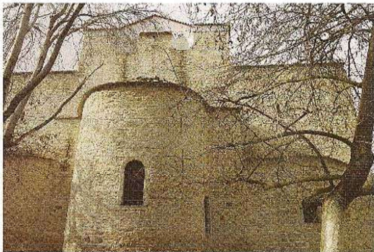
Ο Τερόν Ναός Ἁγίου Χαράλαμπος Κρήνης Μικρῆς Ἀσίας.