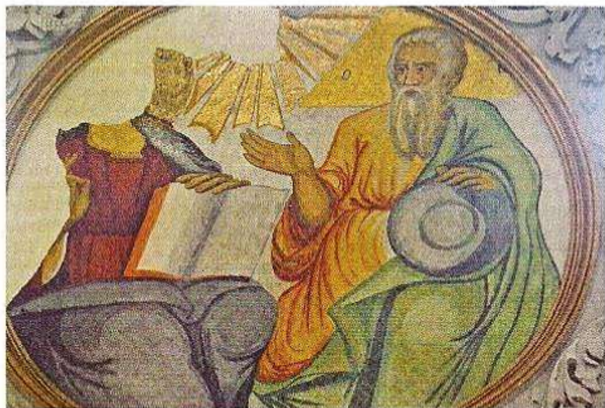
Ἡ Ἁγία Τριάς. (Τοιχογραφία Ἱεροῦ Ναοῦ Ἁγίου Χαραλάμπουε Κρήνης Μικρῆς Ἀσίας).