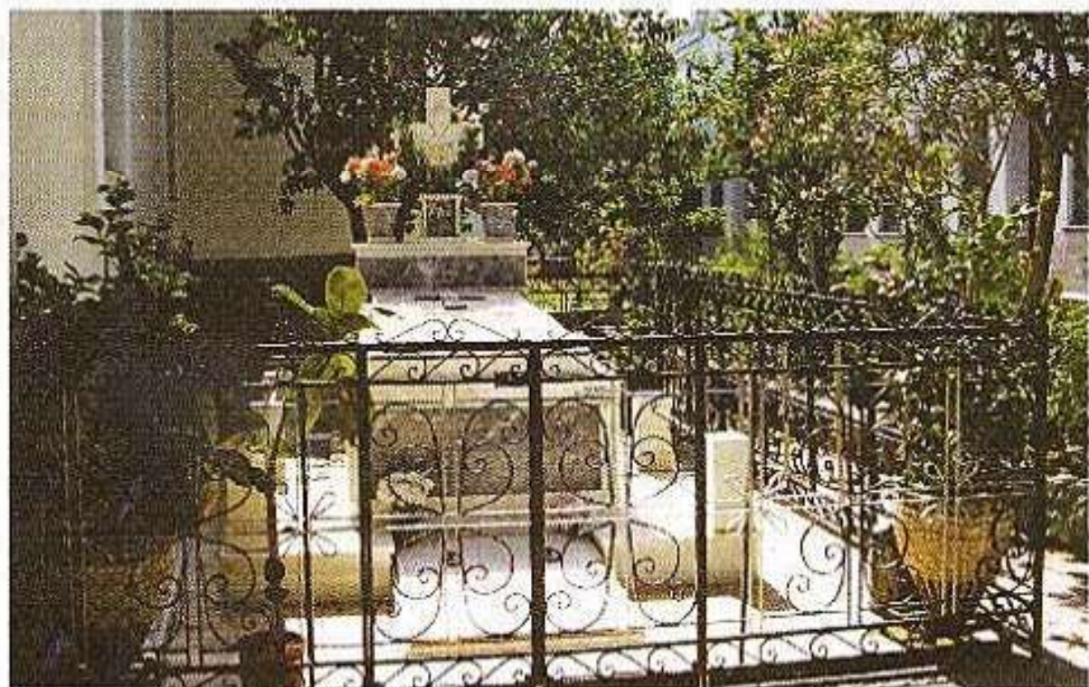
Ὁ τάφος τοῦ Ὁσίου καὶ Θεοφίρου Πατρὸς ἡμῶν Ἀνθίμου τοῦ ἐν Χίῳ, εἰς τὴν Ἱερὰν Μονὴν Παναγίας Βοηθείας Χίου.