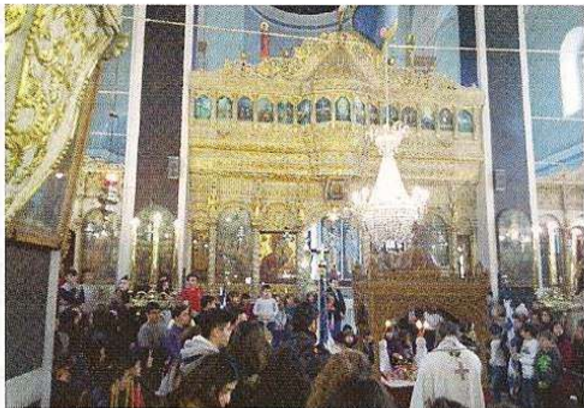
Ἡ Θ. Λειτουργία κατὰ τὴν ἑορτὴν τῶν Τριῶν Ἱεραρχῶν εἰς τὸ κέντρον τοῦ κατόικειου ἀπὸ μαθητᾶς Ἱεροῦ Νικοῦ Κοιμήσεως Θεοτόκου Καλλιμασιᾶς (29.1.2016).