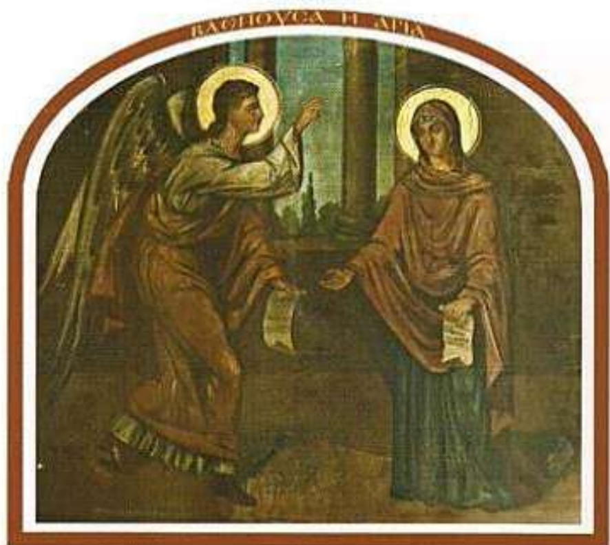
«Βλέπουσα ἡ Ἁγία ἑαυτὴν ἐν ἀγνοίᾳ...». Τοιχογραφία Ἱερᾶς Μονῆς Μυρσινιδίου.