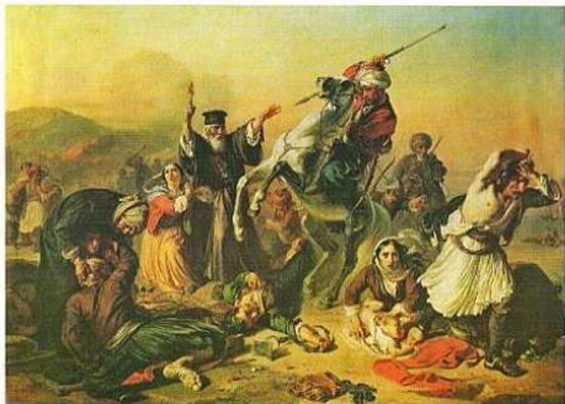
«Ἡ σφαγὴ τῆς Χίου». Ἐλαιογραφία τοῦ Ρώσου ζωγράφου Χυδακοφο.