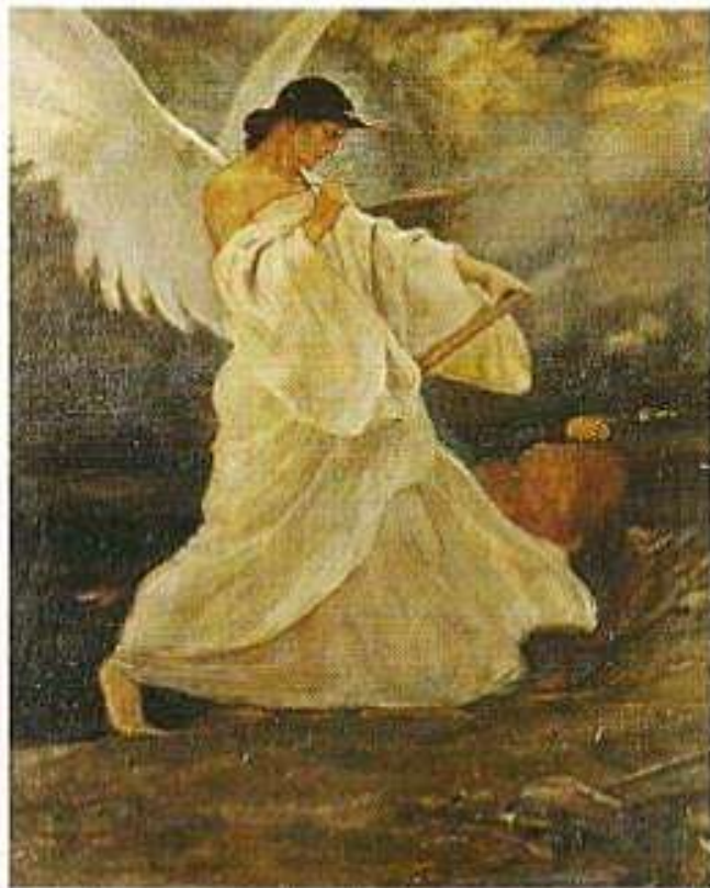
«Η Δόξα τών Ψαρών». Πίναξ Νικολάου Γύζη.