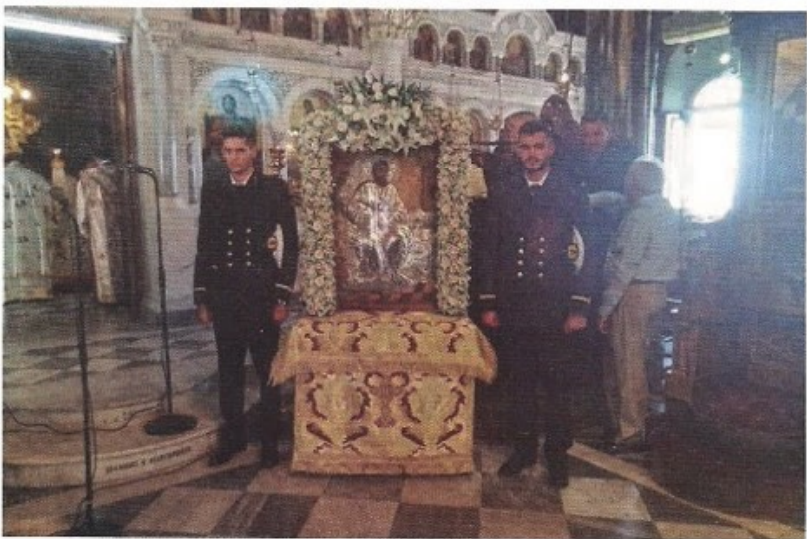
Ἐκκλησία καὶ Ναυτιλία.