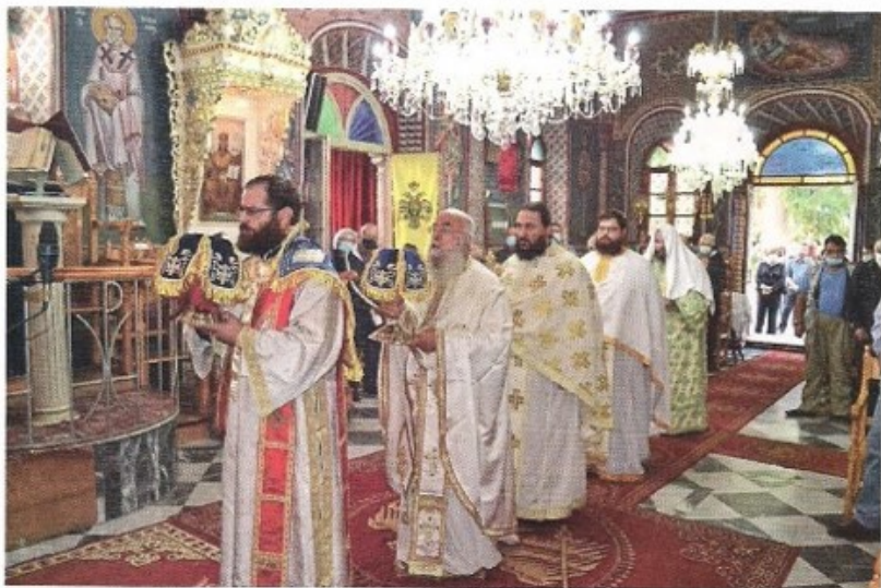
«Πάντων ἡμῶν μνησθεῖτὴ Κύριος ὁ Θεός». (Γ. Ν. Ἀγ. Λουκά Βαρβασιῶν πόλεως Χίου 18.10.2020)