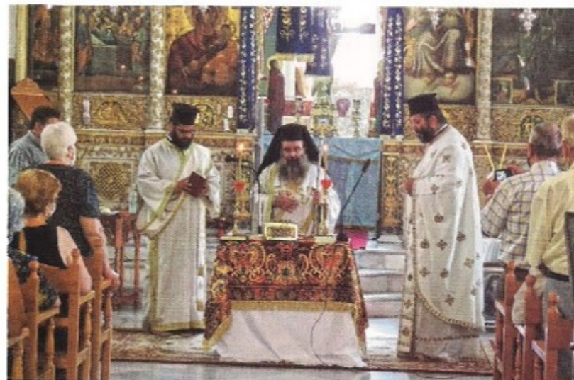
Τέλεσις Θ. Λειτουργίας Ἁγ. Μάρκου. (Γ. Ν. Κοιμήσεως Θεοτόκου Καλλιμασιᾶς 13.9.2020).