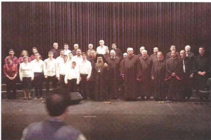
Οί Ίερωτάτες καί Μαθητές εορτάζουν τὰ Χριστούγεννα (22.12.2019).