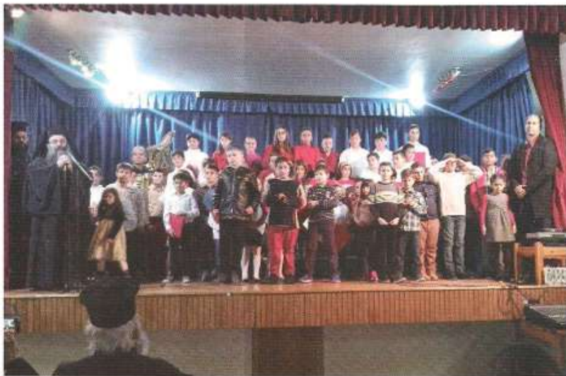
Τά Κατιχητικά Σχολεία της Γ. Μητροπόλεως Χίου εορτάζουν τὰ Χριστούγεννα (20.12.2019).