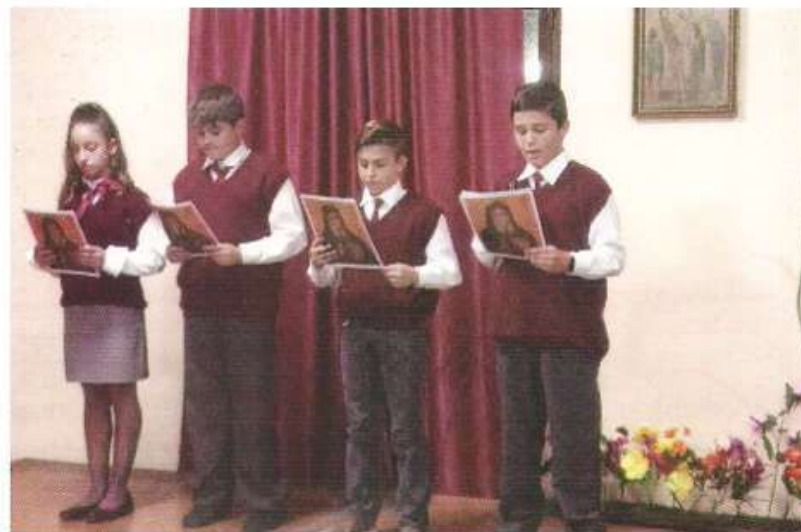
Τιμόντας τὸν Δάσκαλο Ἁγ. Νεκτάριο (19.11.2019).