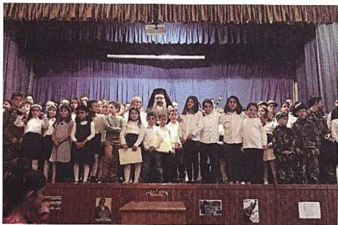
Από τήν ἐκδήλωσιν τῶν Κατηχητικῶν Σχολείων τῆς Ἱ. Μητροπόλεως Χίου ἐπί τῇ ἑορτῇ τῆς 28ης Ὀκτωβρίου 1940 εἰς τήν αἴθουσαν τοῦ Φ.Ο.Β. (27.10.2019).