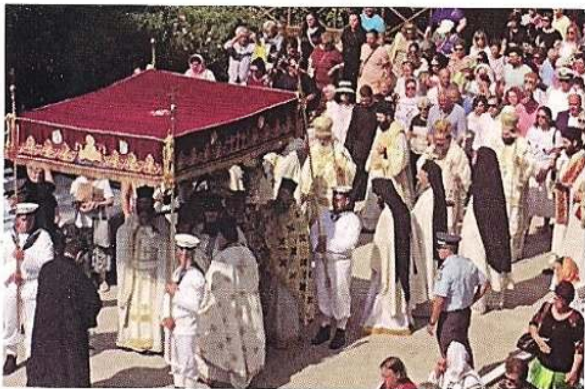
Ἀπὸ τὴν περιφορὰν τῶν Ἱ. Λειψάνων τοῦ Ἀγ. Νεκταρίου εἰς Λέγμιναν (3.9.2019).