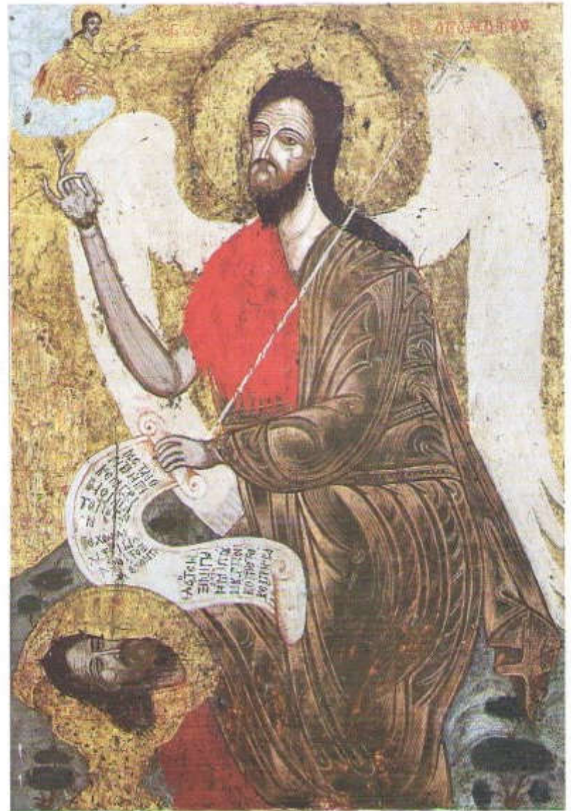
Ἰ. Εἰκὼν Ἁγ. Ἰωάννου Προδρόμου (Τέμπλον Ἁγ. Ἰωάννου Πυραμᾶς Χίου).