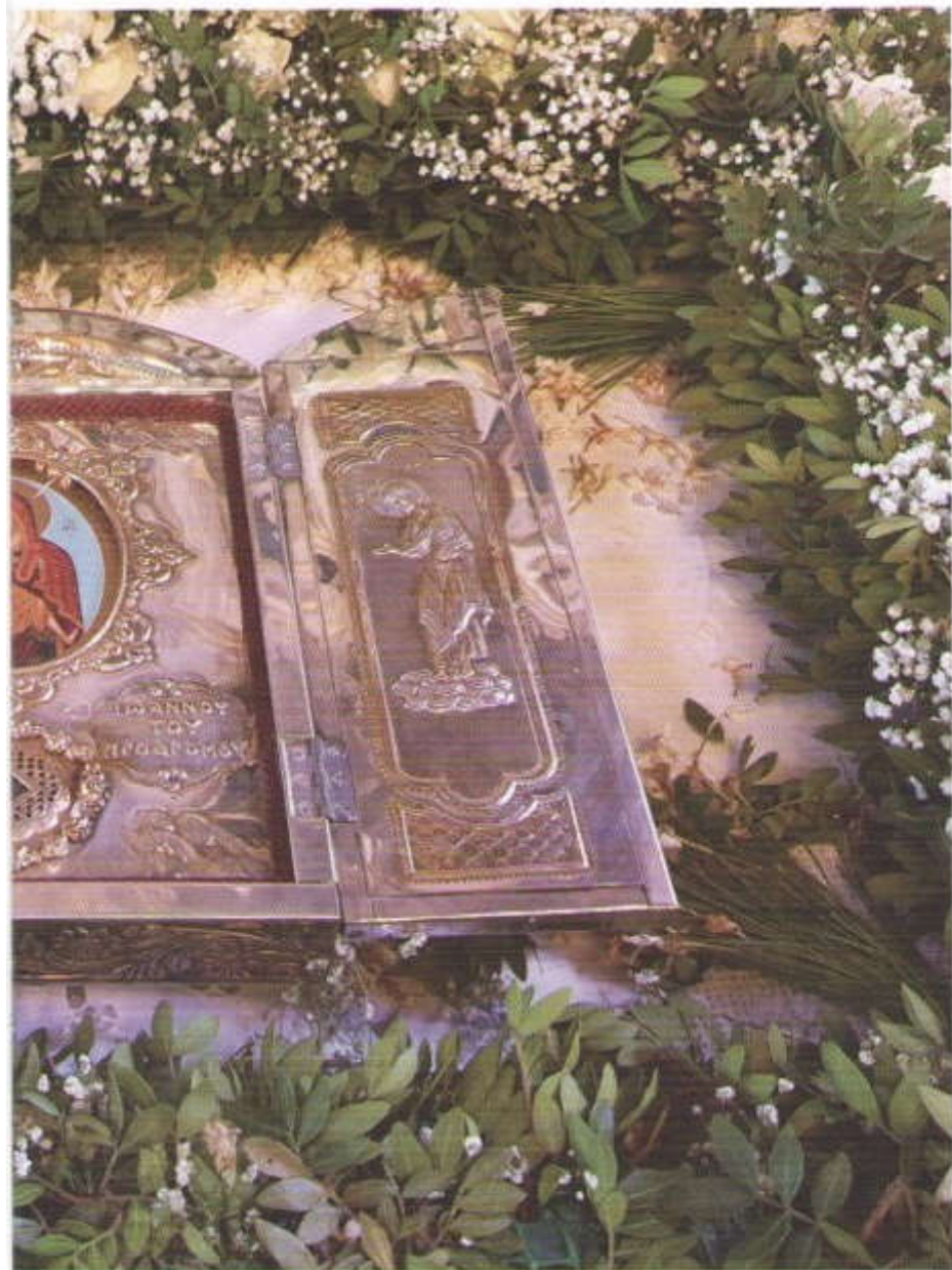
(Ι. Μονή Παναγίας τοῦ Κόζκου Κόζκρου).