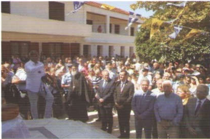
Εύλαβεις τοπικοί άρχοντες και ο πιστός λαός εις τό 'Ι. Προσκύνημα Άγ. Μαρκέλλης Βολισσοῦ. (22.7.2019).