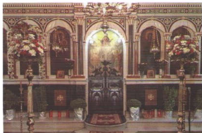
Τὸ Τέμπλον τοῦ Ἱ. Ναοῦ Παναγίας Ἁγιοδεκτηνῆς Κάμπου Χίου.