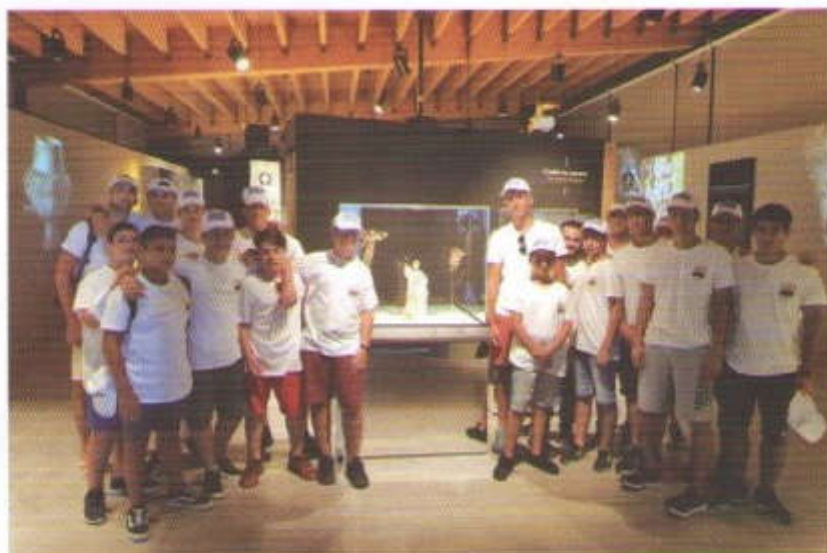
Ἀπὸ τὴν ἐπίσημην τῶν κατασκηνωτῶν τῆς κατασκηνώσεως τῆς Ἱ. Μητροπόλεως Χίου «ΤΟ ΚΑΡΑΒΙ ΤΟΥ ΧΡΙΣΤΟΥ» εἰς τὸ Μουσεῖον Μαστίχας Χίου.