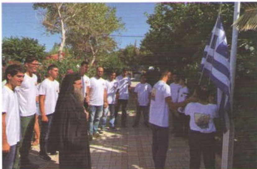
Ἡ ἔπαρσις τῆς Ἑλληνικῆς Σημαίας εἰς τὴν Κατασκηνώσιν τῆς Ἱ. Μητροπόλεως Χίου «ΤΟ ΚΑΡΑΒΙ ΤΟΥ ΧΡΙΣΤΟΥ».