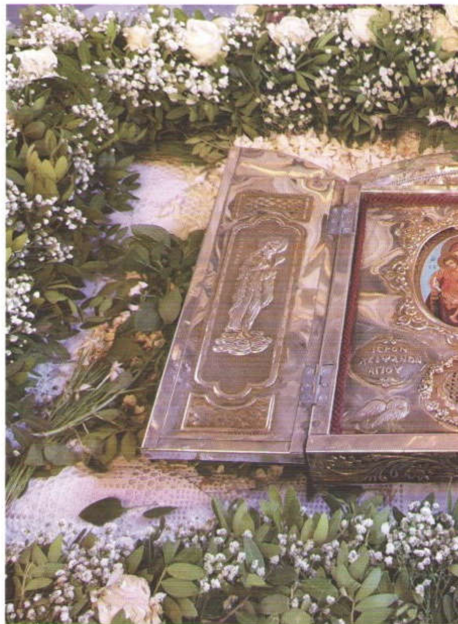
Ἱ. Λείψανον Ἁγ. Ἰωάννου τοῦ Προδρόμου.