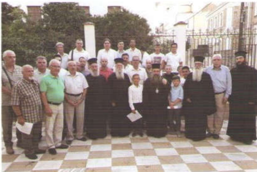
Απονομή έτηρίων ένδεικτικῶν εἰς τοῦς μαθητάς τῆς Σχολῆς Βυζαντινῆς Ἐκκλησιαστικῆς Μουσικῆς τῆς 'Ι. Μητροπόλεως Χίου.