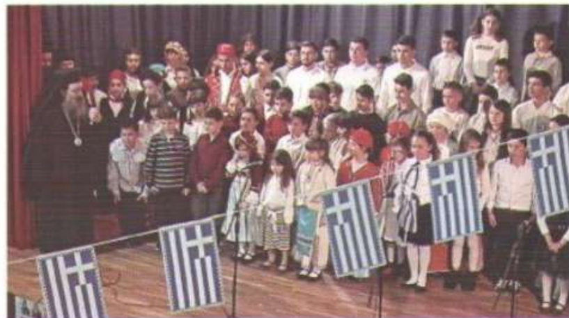
Ὁ ἑορτασμός τῆς Ἐπετείου τῆς 25ης Μαρτίου 1821 ἀπό τά Κατηχητικά Σχολεῖα τῆς Ἱ. Μητροπόλεως Χίου (23.3.2019).