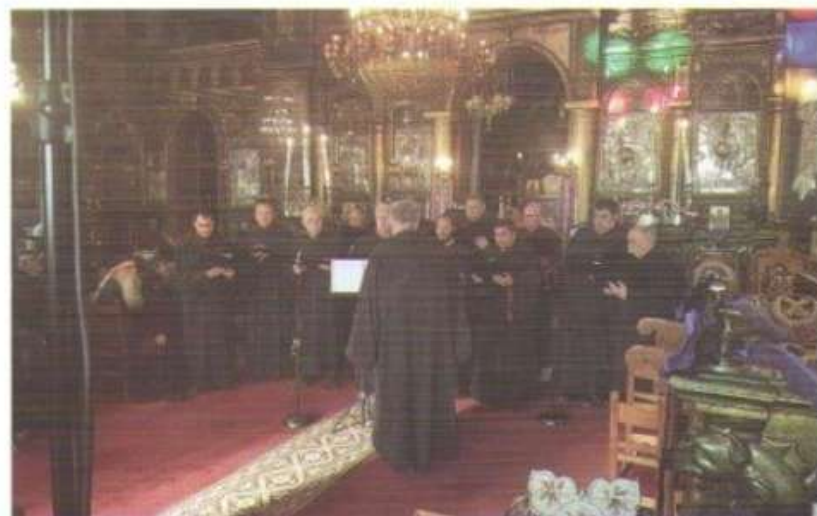
Ἡ χοροψαλμία τοῦ Συλλόγου Ἱεροψαλτῶν Χίου «ΡΩΜΑΝΟΣ Ο ΜΕΛΑΘΟΣ», ψάλλει ὕμνους τῆς Μεγ. Ἑβδομάδος εἰς τόν Ἱ. Ν. Ἁγ. Νικολάου Οἴνουσῶν (1.4.2019).